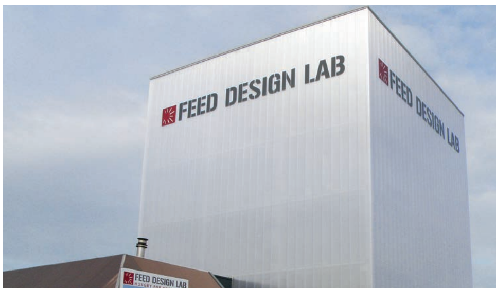
Afb. 1 Feed Design Lab in Wanssum

Na jaren van brainstormen en het zoeken van partners en mede-investeerdere werd uiteindelijk de stichting een feit en volgde het startsein voor de bouw van een innovatieve onderzoeksfaciliteit met drie hoofdlijnen: een maal/menglijn, een extrusie/