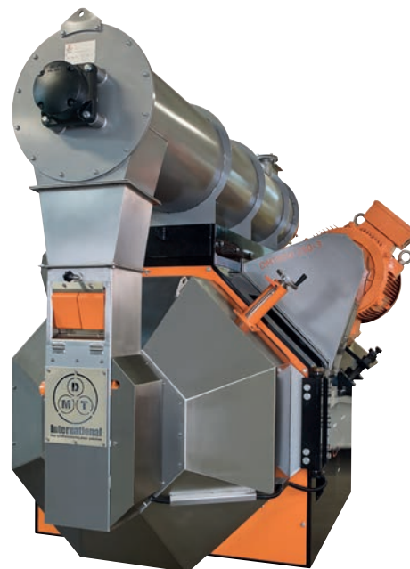
Afb. 4 Een Taurus korrepers van DMT

ARCO Solutions voorzag in een 'flash off'-band waarmee hete en oliehoudende korrels beheerst worden opgevangen en getransporteerd, zodat korrelbreuk tot een minimum blijft beperkt. Ook is op de band een module geïnstalleerd die de korrels afkoelt en voorkomt dat ze gaan kleven.