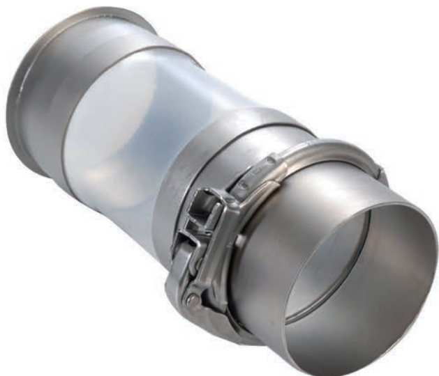
Afb. 5 Flexibele verbinding van Euro Manchetten & Compensatoren

De Counterflow Batch Dryers zijn inmiddels de standaard voor de grootste petfood- en aquafeed-producenten ter wereld. De nieuwste generatie (MkIV) kan, behalve met alleen gasbranders, ook met gasbranders én warmtepompen worden uitgerust. Daarmee is 100% elektrisch en CO 2 -vrij drogen mogelijk. Het condenseren van de natte drooglucht met behulp van een Counterflow Recovery Unit leidt daarbij tot 60-80% reductie van het netto energieverbruik en een lagere Total Cost of Ownership. In dat geval dienen de gasbranders als back-up, of voor het bereiken van droogluchttemperaturen boven 120°C, of voor optimalisatie van operationele kosten bij tijdelijk hoge stroomprijzen. Veel producenten kiezen nu voor de MkIV generatie omdat die later uit te rusten is met