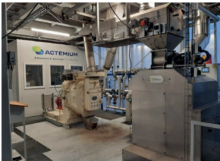
Afb. 3 Met de procesautomatisering van Actemium functioneert de proeffabriek als één geheel