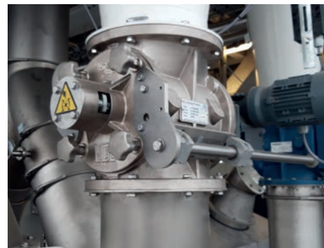
Afb. 10 De VDL 'Easy clean' draaisluis, voor efficiënt onderhoud

Van Mourik Smart Milling Engineers is dankzij haar proceskennis in staat om bij aanpassingen of nieuwbouw van installaties deskundig te adviseren, bottle-necks