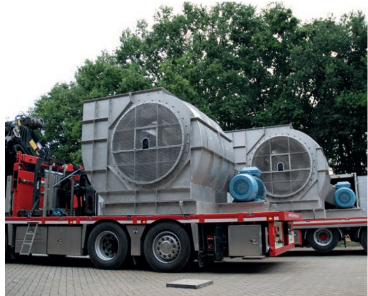
Afb. 8 Industriële ventilatoren van Rotodyne Asselbergs

warmtewisselaars en warmtepompen, bijvoorbeeld zodra aardgas- of CO 2 prijzen te veel invloed krijgen op de operationele kosten.