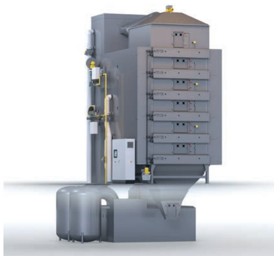
Afb. 6 Hybride gas/elektrische droger/koeler van Geelen Counterflow