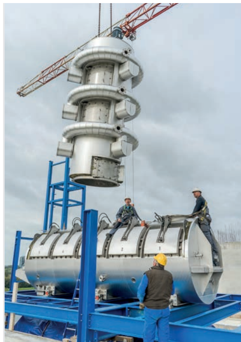
Afb. 9 Project van Van Mourik Smart Milling Engineers

en de productie van industriële ventilatoren samengebracht.